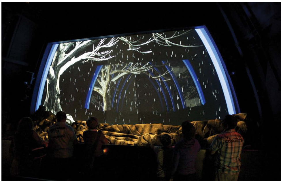
SPECTACLE MULTIMÉDIA QUI REPREND LA FORME DES ARCS EN OGIVE.