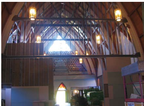
TRAVAUX DE TRANSFORMATION DE L'ÉGLISE QUI DIVISENT L'ESPACE.