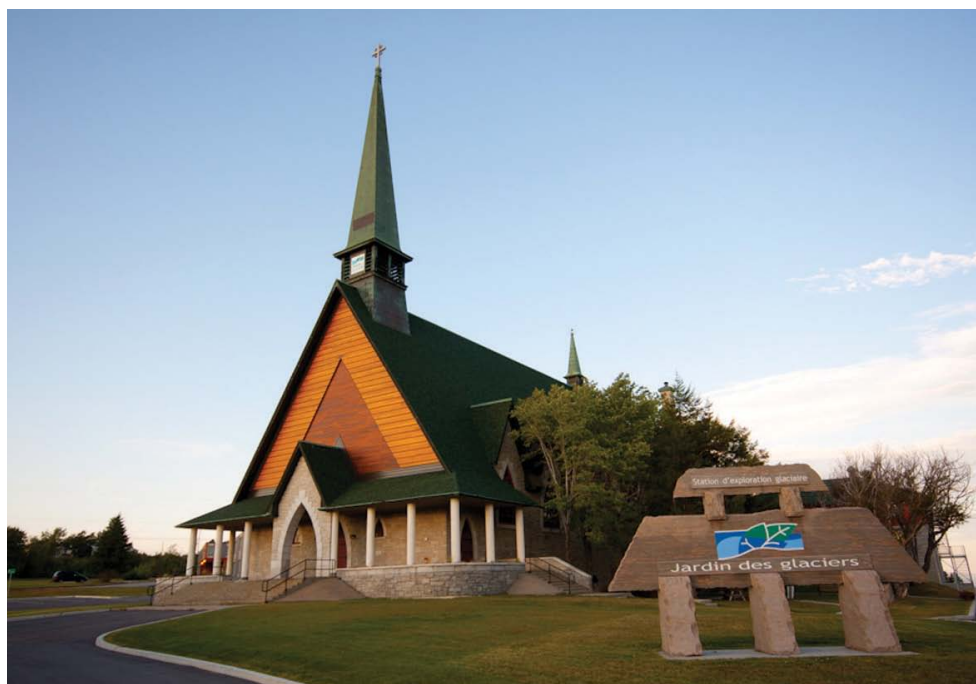
STATION D'EXPLORATION GLACIAIRE DU JARDIN DES GLACIERS.

Une station d'exploration de classe mondiale