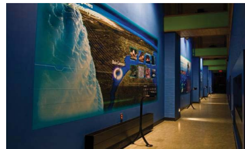
ESPACE LATÉRAL DE L'ÉGLISE TRANSFORMÉ EN COULOIR AVEC DES PANNEAUX D'INTERPRÉTATION.