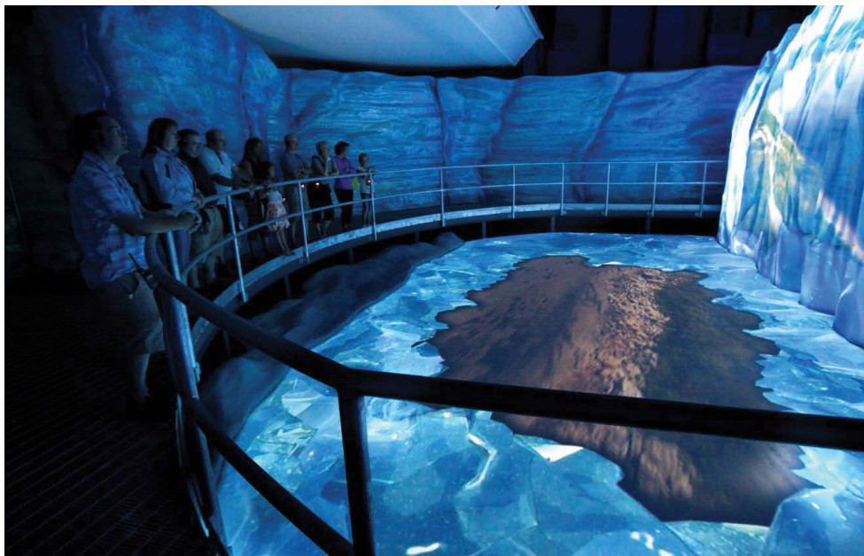
SPECTACLE MULTIMÉDIA.

L'église Saint-Georges est construite en 1955 selon les plans de Sylvio Brassard. Sa toiture à angle très prononcé se prolonge à l'avant pour recouvrir une galerie qui déborde sur les côtés. Un portique monumental en pierre, en forme d'ogive, marque l'entrée principale de l'église. Les fenêtres latérales du bâtiment, qui sont aussi en forme d'ogive, sont accentuées par des lucarnes pignons. Le mur pignon de la façade avant présente une fenestration différente, avec une forme triangulaire et des lignes droites accentuées par le fin carrelage. À l'intérieur, la nef à un vaisseau est rythmée par des arcs de forme ogivale qui se détachent à leur base des murs latéraux pour créer une perspective de fermeture vers le chœur. Le plafond, constitué de caissons de bois, contribue à l'allure moderne de l'édifice.