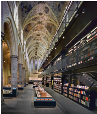
Vue de la bibliothèque

Photo : Roos Aldershoff, Merx+Girod architects