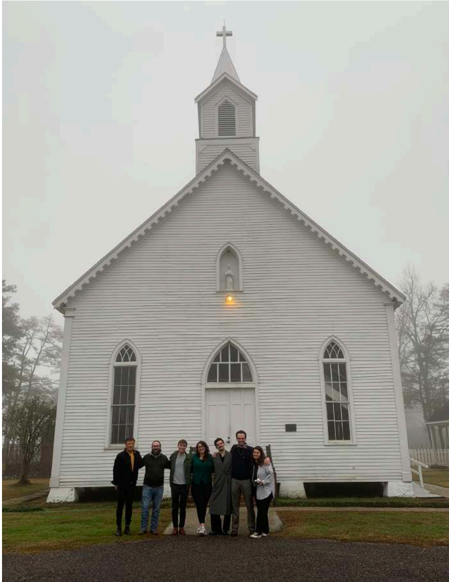
Visite de l'église Saint-François de Pointe Coupée