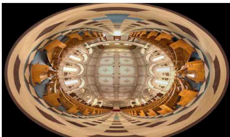
Le patrimoine religieux... fragile comme un œuf

https://www.ville.sorel-tracy.qc.ca/loisirs/loisirs-et-culture/maison-des-gouverneurs