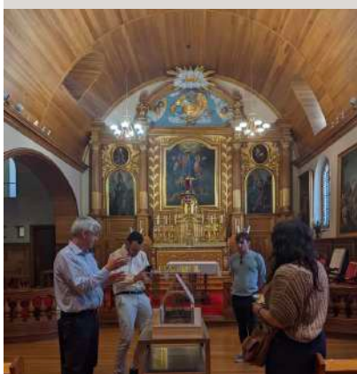
Visite de la délégation louisianaise à l'Hôpital général de Québec le lundi 11 septembre

Le Conseil du patrimoine religieux du Québec a reçu un avis favorable à sa demande de subvention déposée au programme de coopération Québec-Louisiane du ministère des Relations internationales et de la Francophonie. Le projet a pour objectif d'établir de nouveaux liens et de partager de meilleures pratiques entre les acteurs responsables de la transmission du patrimoine matériel et immatériel au Québec et en Louisiane. Des conférences données par la délégation louisianaise en visite au Québec et par celle du CPRQ en séjour en Louisiane mettront en valeur les liens entre l'histoire et les legs de ces deux territoires de l'Amérique du Nord. L'échange s'immortalisera grâce à la création d'un outil numérique qui comprendra des cartes interactives et une série de capsules vidéo mises en ligne après la réalisation du projet.