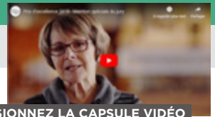
VISIONNEZ LA CAPSULE VIDÉO