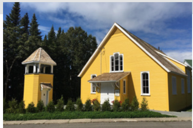
Restauration de l'église Little Metis Presbyterian Church Little Metis Presbyterian Church (Bas-Saint-Laurent)