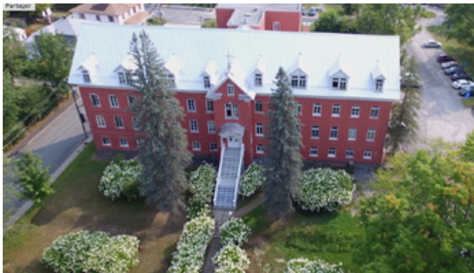
Restauration de la toiture du couvent Mont-Saint-Patrice à Richmond Corporation du couvent Mont-Saint-Patrice (Estrie)