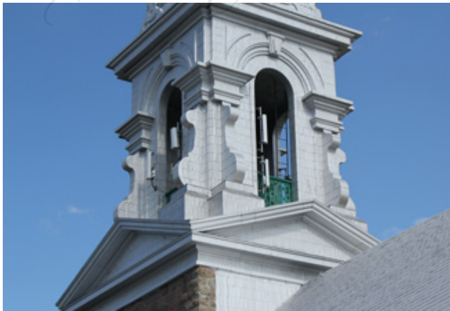
Restauration de l'église Notre-Dame de l'Assomption d'Hébertville Fabrique de la paroisse Notre-Dame de l'Assomption (Saguenay-Lac-Saint-Jean)