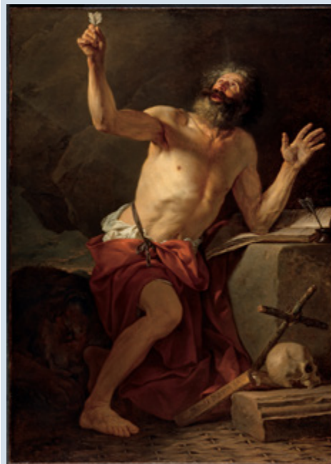
Jacques-Louis David (1748-1825), Saint Jérôme entendant les trompettes du Jugement dernier, 1779, huile sur toile, 174 x 124 cm. Prêt du Musée de la civilisation, collection de la Fabrique de la Paroisse de Notre-Dame-de-Québec

De plus, la ministre a mandaté son personnel pour qu'il développe une stratégie de protection des biens mobiliers à caractère religieux du Québec. L'objectif de cette démarche vise notamment à inventorier ces biens mobiliers, à évaluer leur valeur patrimoniale et à protéger ceux qui possèdent un intérêt à l'échelle nationale pour assurer leur conservation au Québec.