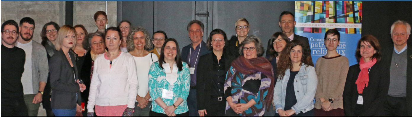
Accueil de la délégation française le 9 avril 2018 : le contexte montréalais