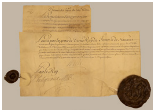
Lettres patentes du roi de France et de Navarre permettant l'établissement d'une communauté religieuse autonome à l'Hôpital général de Québec

Le fonds d'archives est composé de documents textuels et photographiques dont les plus anciens remontent à 1631. En plus de témoigner de l'histoire de l'Hôpital général de Québec et des Augustines, cette volumineuse documentation améliore la connaissance de l'histoire de la ville de Québec et de l'évolution des soins de santé et des services sociaux au Québec. La collection de livres anciens compte quelques documents manuscrits et environ 2800 imprimés, produits et publiés de 1597 jusqu'au milieu du XX e siècle. La collection d'objets contient une sélection de 1800 biens mobiliers fabriqués entre la fin du XVI e siècle et le début du XX e siècle. Elle constitue l'une des plus anciennes collections de biens mobiliers au Québec et au Canada.