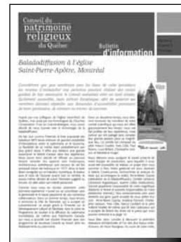
www.lieuxdeculte.qc.ca Visiteurs de l'année 2007

Publié quatre fois par année, le bulletin d'information du Conseil s'est aussi refait une beauté au printemps 2007. Sa mise en page a été repensée, une nouvelle « image de marque » du Conseil étant appliquée à l'ensemble des communications de l'organisation. Le Conseil sera donc facilement identifiable dans toutes ses publications et ses actions au sein de sa nouvelle mission élargie.