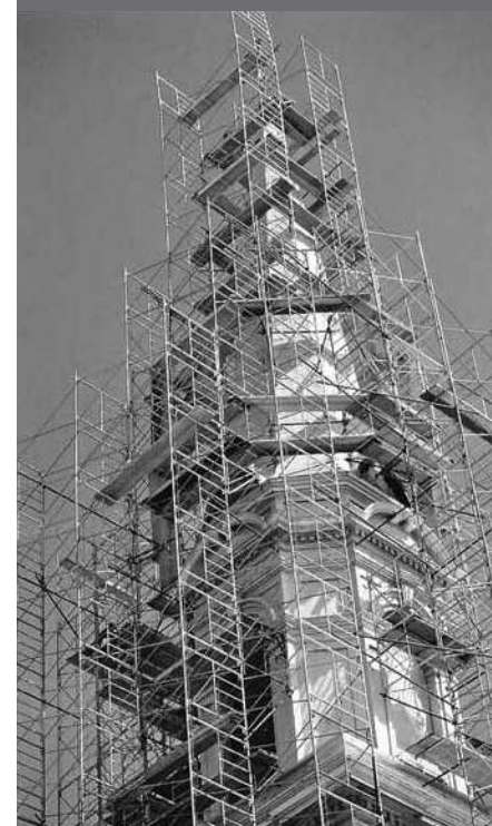
Église Saint-Joseph, Carleton-sur-Mer Architectes Proulx & Savard