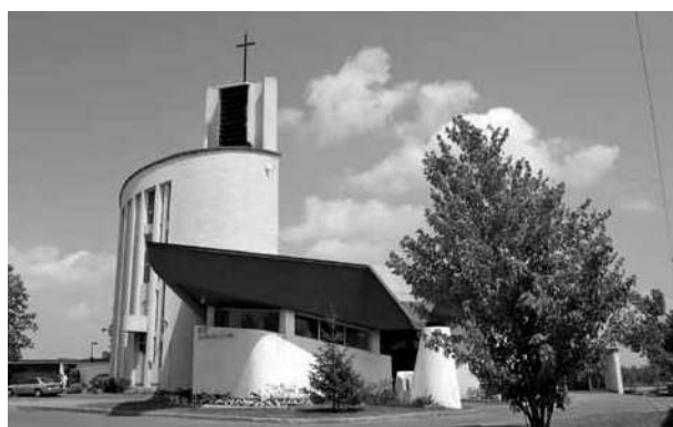
Église Notre-Dame-d'Anjou, Montréal

Dans le cadre de l'Entente sur le développement culturel entre la Ville de Montréal et le ministère de la Culture, des Communications et de la Condition féminine, et avec la participation du Conseil du patrimoine de Montréal, le Conseil a poursuivi et terminé la réalisation de l'évaluation patrimoniale et de la classification de 210 lieux de culte construits entre 1945 et 1975 sur le territoire de l'île de Montréal.