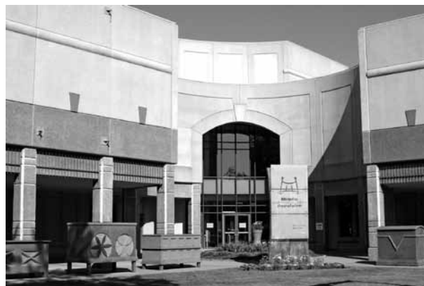
Musée québécois de culture populaire, Trois-Rivières