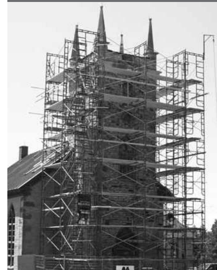
Église unie Saint-Mungo, Brownsburg-Chatham DSF inc. Architecture et Design

Ainsi, la Fondation a modifié sa raison sociale pour celle de Conseil du patrimoine religieux du Québec afin de mieux représenter les réalités de ses activités et d'élargir son mandat. Celui-ci avait été limité, jusque là, à la gestion du programme de financement des projets de restauration du patrimoine religieux immobilier et mobilier, à la réalisation d'inventaires et, dans une moindre mesure, à des activités de sensibilisation telles que des colloques sur le patrimoine religieux, tandis qu'il vise maintenant à faire, du nouveau conseil, un « partenaire » des communautés religieuses, du gouvernement, des municipalités, des municipalités régionales de comté (MRC) et de tout autre intervenant dans le domaine.