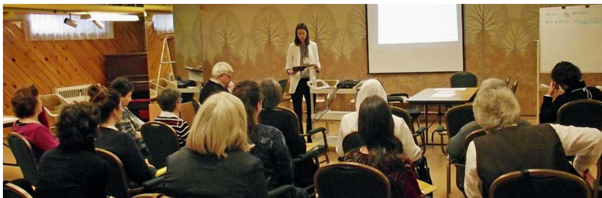
Activité de remue-méninges, TCARM, février 2016, les Frères de Saint-Gabriel, boulevard Gouin, Montréal

Fondée en janvier 2014, la Table de concertation des archives religieuses de la région de Montréal (TCARM) est une initiative du Regroupement des archivistes religieux et de congrégations concernées par la sauvegarde et la mise en valeur de leur patrimoine archivistique.