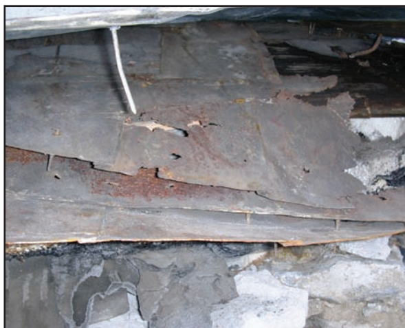
Anciens revêtements de toiture du Séminaire de Saint-Sulpice (Montréal) sous le revêtement actuel

La première question à se poser concerne l'étendue des interventions essentielles. On se doit d'identifier les problèmes, puis de déterminer les actions pouvant y remédier. À l'occasion, on peut aussi découvrir des problèmes aux murs attribuables à des causes associées au toit. Par exemple, un profil approprié pour les larmiers au niveau des débords de toit est essentiel pour éviter le ruissellement de l'eau sur les murs plus bas. Et dans le domaine de la conservation, il est toujours recommandé de régler les problèmes à partir de leur source en premier lieu. Une expertise approfondie effectuée par un professionnel, qui exige souvent une investigation et un curetage directement sur ou sous le revêtement de toiture, est donc nécessaire.