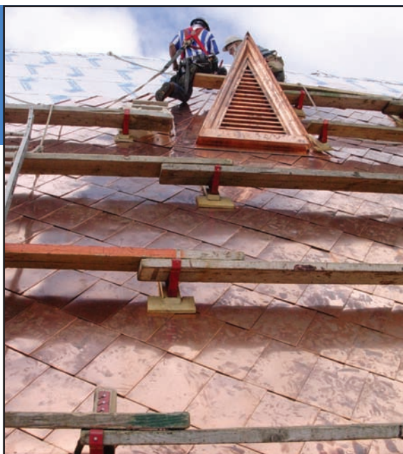
Chantier illustrant l'installation d'un revêtement de cuivre « à la canadienne » sur l'église Saint-Frédéric (Drummondville)

Certains matériaux exigent aussi une pente plus abrupte que d'autres. L'ardoise et le bardeau de cèdre, à cause de la petite dimension de leurs modules, exigent par exemple des pentes de l'ordre d'au moins 8 sur 12. Une technique de pose peut elle aussi être associée à un matériau. L'usage du fer-blanc pour la tôle posée « à la canadienne » en est un bon exemple. Cependant, le cuivre naturel peut aussi avoir été utilisé pour ce type de pose.