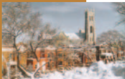
Église Saint-Viateur 1999 *