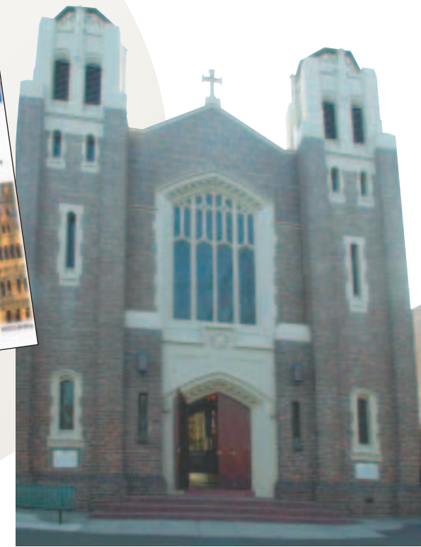
St Carthages, Melbourne