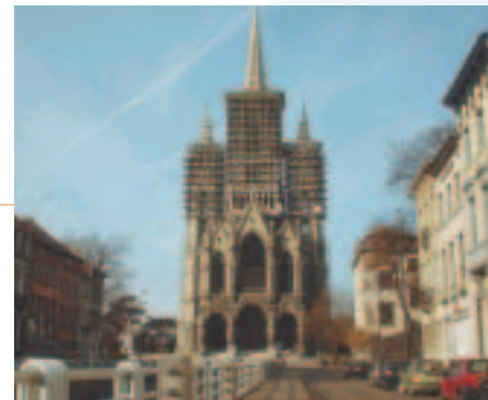
Notre-Dame de Laeken, Bruxelles