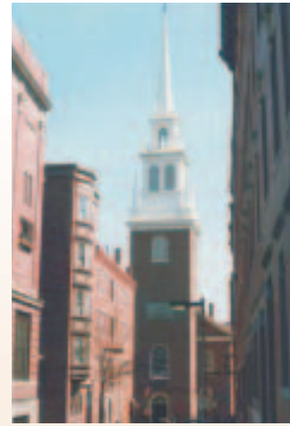
Old North Church, Boston

Rivales dans l'histoire comme sur la patinoire, Boston et Montréal se comparent aussi sur le plan du patrimoine religieux. On y compte plus de 360 églises catholiques, près de 200 églises épiscopaliennes et de nombre d'autres communautés. Des initiatives ont cours sous l'action conjuguée de l'État du Massachusetts, qui mena, par le truchement de sa commission des lieux historiques, des recherches et des inventaires en vue d'attribuer des statuts et de réaliser des projets de mise en valeur. Les autorités municipales interviennent en désignant des secteurs patrimoniaux qui bénéficient ensuite de stratégies de conservation et de revitalisation d'ensemble, élaborées et mises en œuvre par les services de la Ville et la Boston Redevelopment Authority, une corporation publique qui soutient des approches urbanistiques. De telles stratégies jouissent aussi du concours d'organismes privés comme le Historic Boston Inc. ( www.historicboston.org ), qui aident au financement de projets de conservation dans leurs opérations propres ou comme agent pour la mise en œuvre de programmes nationaux comme le Steeples Project. En 1991, le Historic Boston publia un recueil d'études de cas en conservation du patrimoine religieux, lequel est actuellement mis à jour.