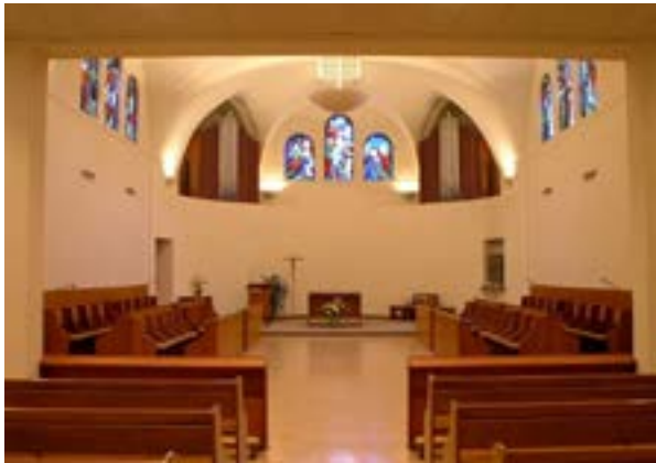
Intérieur de la chapelle lors de l'inventaire des lieux de culte

Mentionnons en outre qu'il s'agit du premier établissement au Québec et au Canada de cette communauté religieuse contemplative fondée par saint Dominique au XIII e siècle en France. Les Moniales dominicaines y ont résidé de 1934 à 2012, accueillant la population locale dans leur chapelle conventuelle. Elles ont pu compter sur les dons de la population berthelaise pour assurer leur subsistance et financer les travaux d'agrandissement.