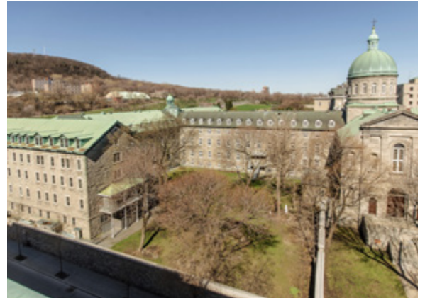
Ensemble conventuel des religieuses hospitalières de Saint-Joseph

Une vidéo a été réalisée pour présenter le projet : La Cité des Hospitalières, une vocation consacrée au vivre-ensemble.