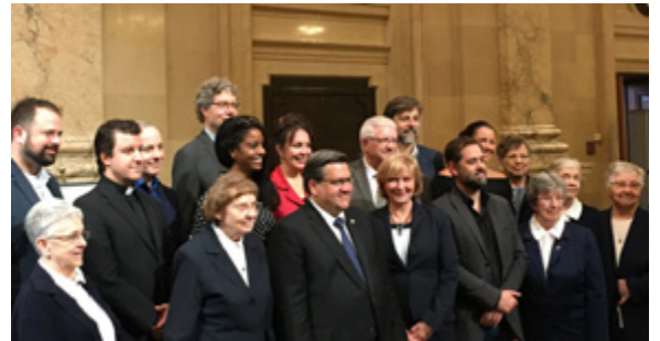
Photographie prise lors de l'annonce de l'acquisition