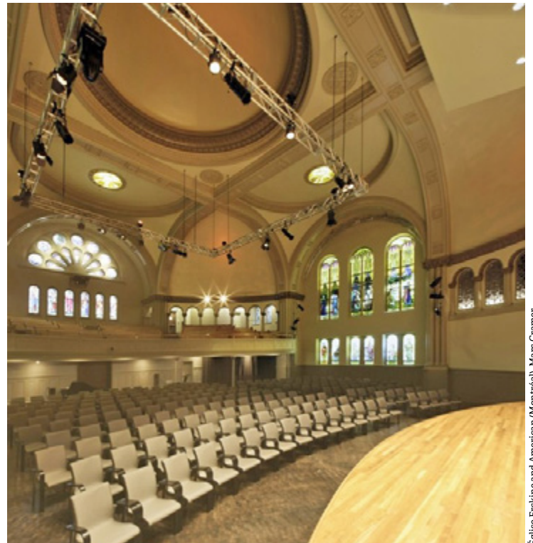
Église Erskine and American (Montréal), Marc Cramer.