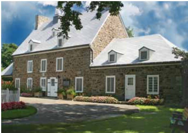
Collection Maison Saint-Gabriel

Depuis les douze dernières années, la Maison Saint-Gabriel a connu un développement impressionnant. Alors qu'en 1997, le site attirait quelque 7 000 visiteurs, il en accueille aujourd'hui plus de 75 000. Avec le jardin de la métairie, ouvert en 2000, la programmation estivale, la Semaine des quêteux et d'autres événements majeurs, le musée a élargi et bonifié son offre. Il intéresse les jeunes, attire les familles et interpelle les touristes, de plus en plus nombreux à s'orienter vers Pointe-Saint-Charles. La Maison Saint-Gabriel est devenue une destination.